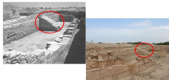
図 2：神殿の過去(1958) [2]と現状(2017)の違い

写実的な 3 次元 CG により文化財の現状を復元して、過去の記録写真と重ね合わせるために、図 3 に示すようなシステムを構築する。まず、複数の画像から現状の 3 次元形状を SfM (Structure