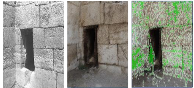
図5：過去 (1960) [2]と現状(2017)の重畳表示