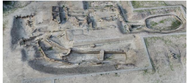
図 1：バルバル神殿の全体像

3-3-35 Yamate, Suita, OSAKA, 564-8680, JAPAN